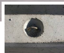
Detalle del cáncamo de izaje